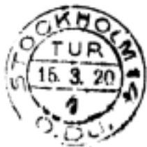
Fyran i kant med bandet