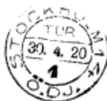
fyran långt uder bandet