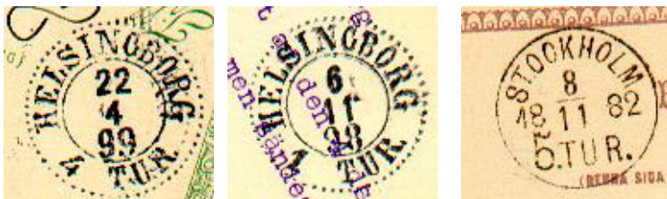
Helsingborg 4 tur smalt O 22.4.99 Helsingborg 1 tur smalt O 6.11.98 Stockholm 5 tur 8.11.82