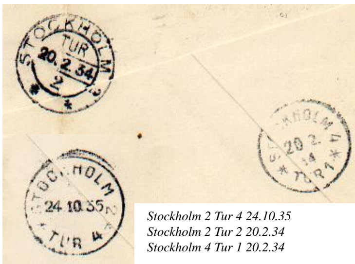
Stockholm 2 Tur 4 24.10.35 Stockholm 2 Tur 2 20.2.34 Stockholm 4 Tur 1 20.2.34