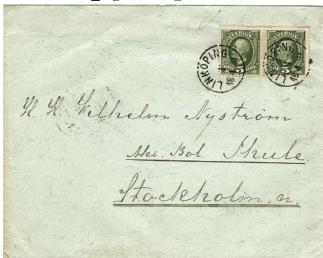
Linköping 1-4-1891 n16

Undrar Sten Lagerholm sten_lagerholm@hotmail.com