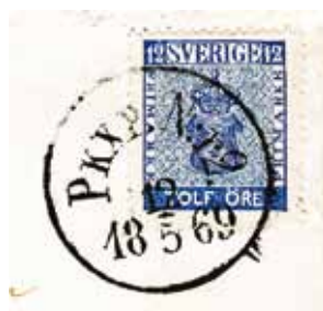
Typ 2: Pkxp N:r 2 typ 2, diameter 26,5 mm och avstånd från P:ets överdel till ramens underkant är 2 mm. portosatsen.