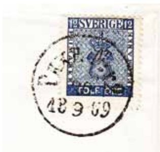
Typ 1: Pkxp N:r 2 typ 1, diameter 26 mm och avstånd från P:ets överdel till ramens underkant är 1 mm.

Jag kallar den ena typ 1 då den är mindre och de flesta större normalstämplarna 10 kom i slutet på 1860-talet.