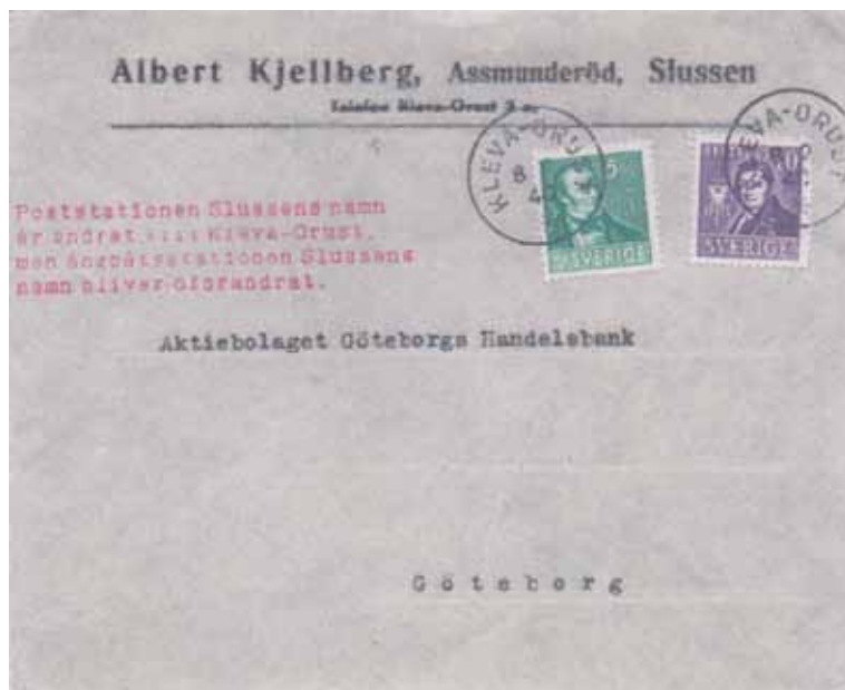
Brev med sidostämpel om namnändringen.

Också om det möjligen finns stämpelar av samma karaktär från andra namnändrade postanstalter. ♦