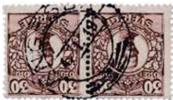
Normalstämpel 58p, Ängesdal 4.1.19.