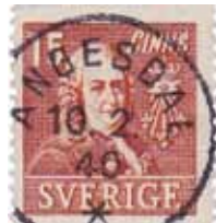
Normalstämpel 59b, Ängesdal 10.2.40.